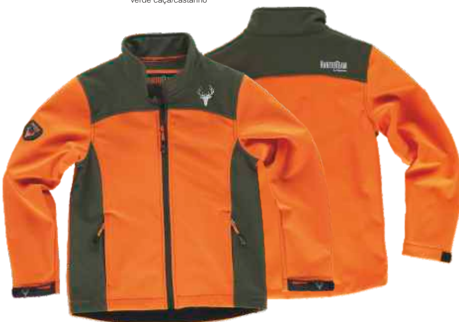
laranja a.v./verde caça

Tecido: 96% Poliéster 4% Elastano (300 g/m2)