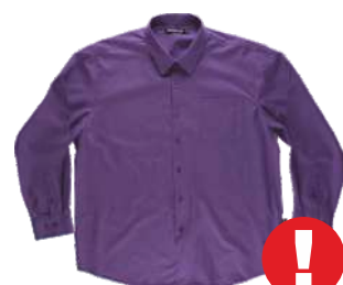
Até o fim do estoque cor roxo