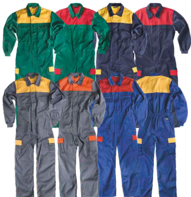
cinzento/amarelo cinzento/laranja azulina/vermelho azulina/amarelo