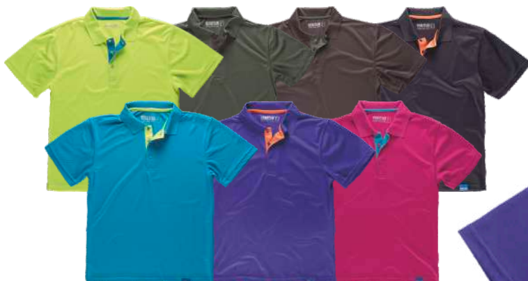
turquesa/amarelo a.v. roxo/laranja a.v. rosa/turquesa