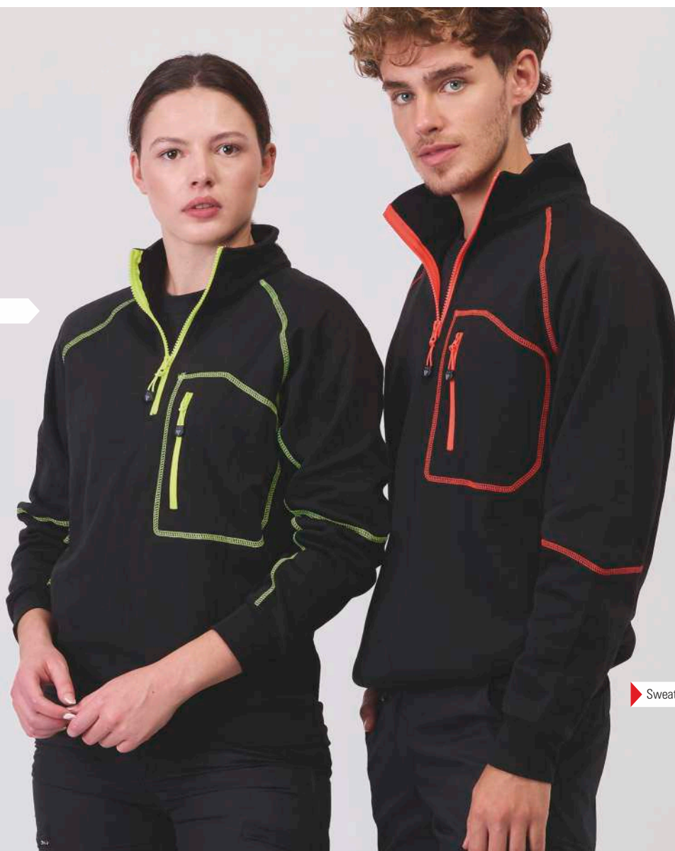
► Sweatshirt C9800