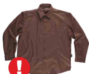
Até o fim do estoque cor castanho