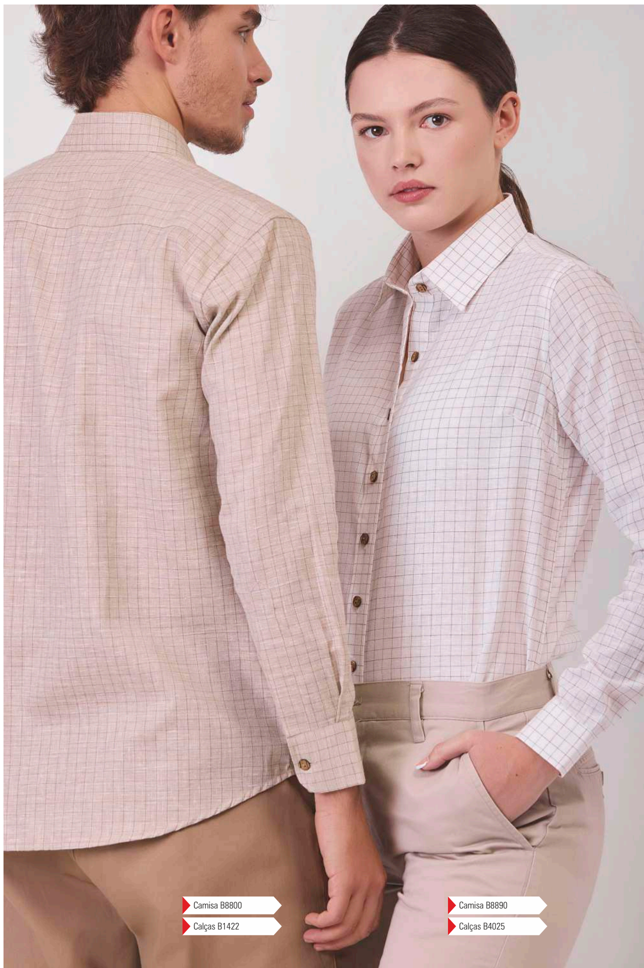
▶ Camisa B8800 ▶ Calças B1422