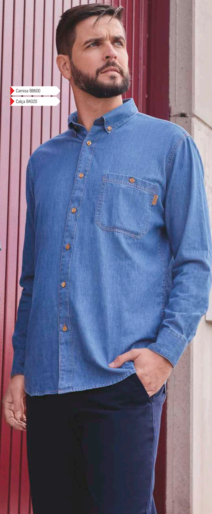
Camisa B8600 Calça B4020