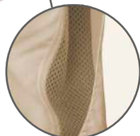
Tecido de malha nas costas