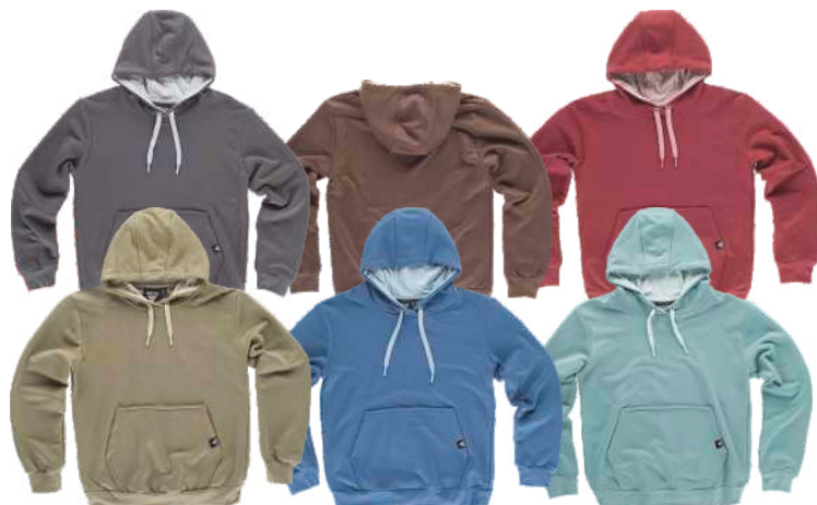
verde azeitona/verde taupe