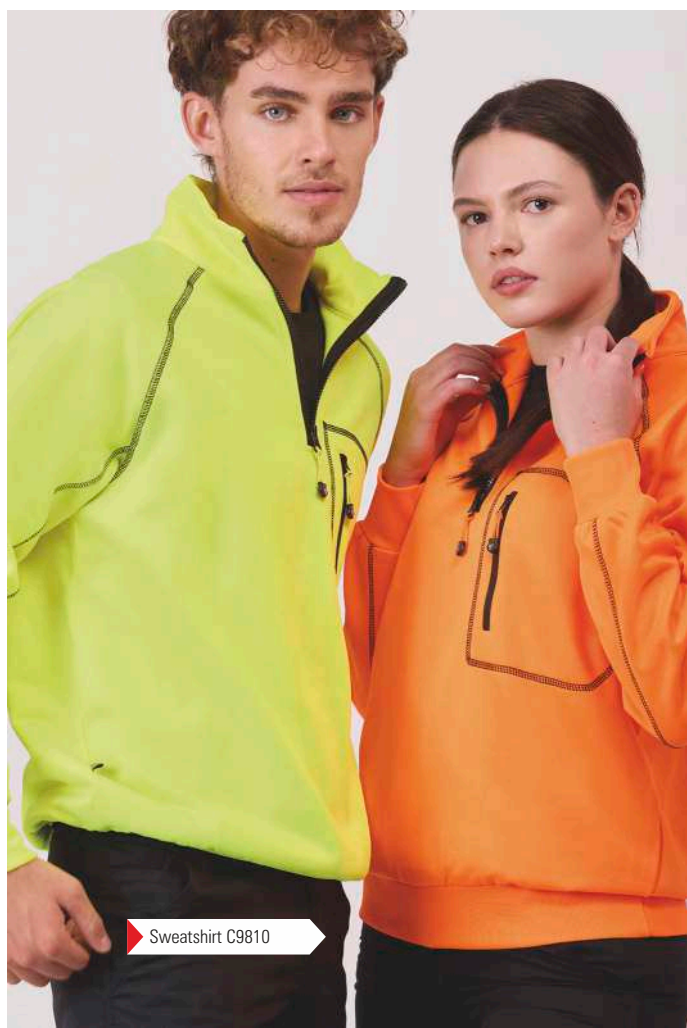
► Sweatshirt C9810