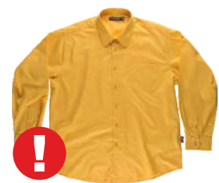
Até o fim do estoque cor amarelo