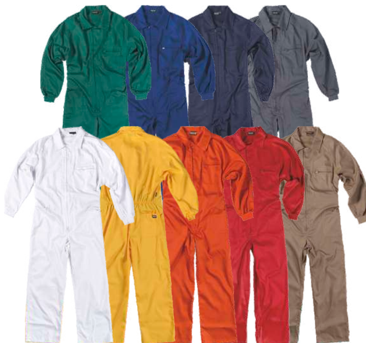
branco amarelo laranja vermelho bege