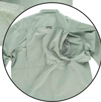
Tecido de malha nas costas