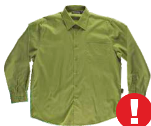
Até o fim do estoque cor pistácio