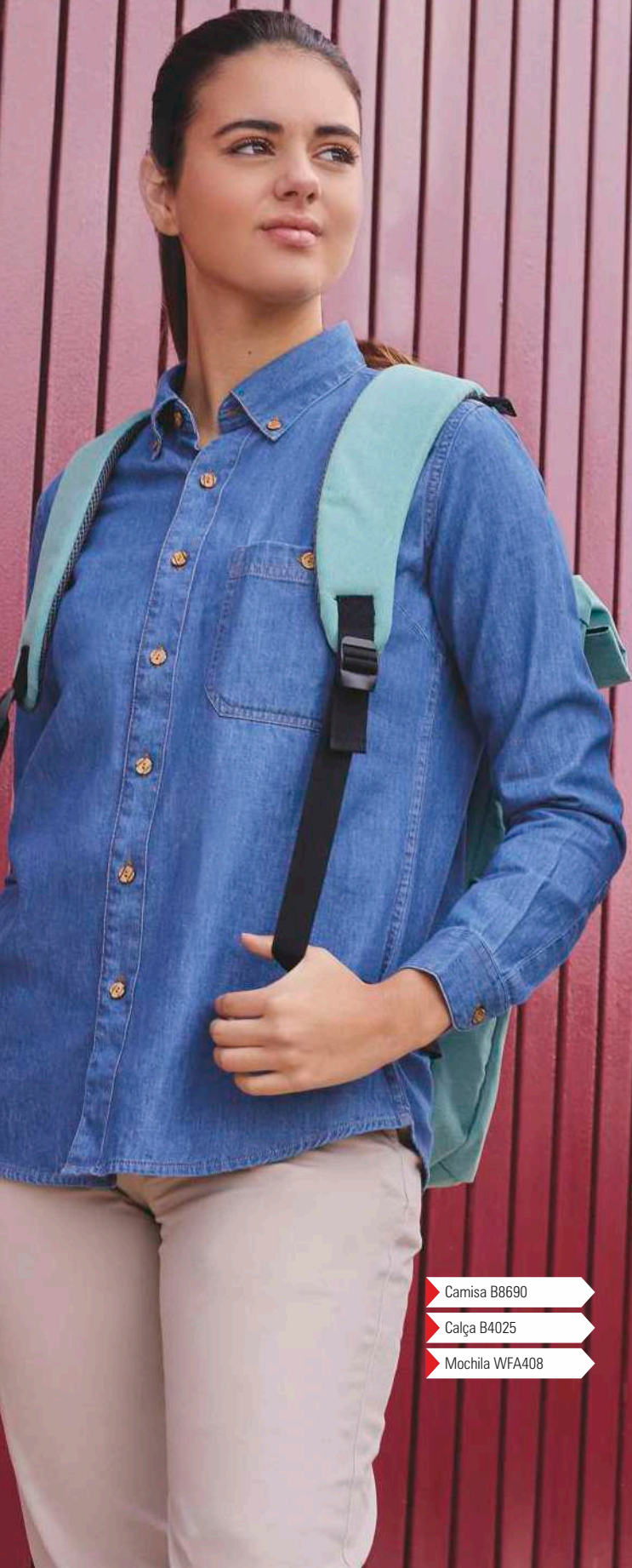
Camisa B8690 Calça B4025 Mochila WFA408